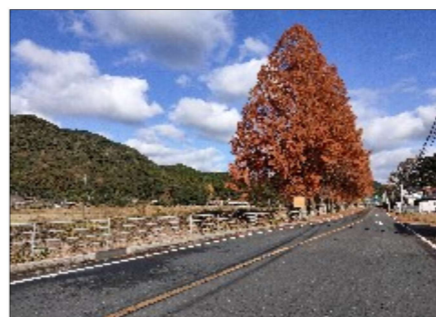
真長田地区のメタセコイア