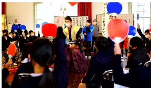
豊北小学校 新春俳句相撲大会