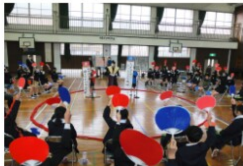
豊北小学校 新春俳句相撲大会