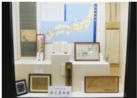
菊舎史料展示コーナー 下関市庁舎四階食堂横 一月十六日(約半年間)